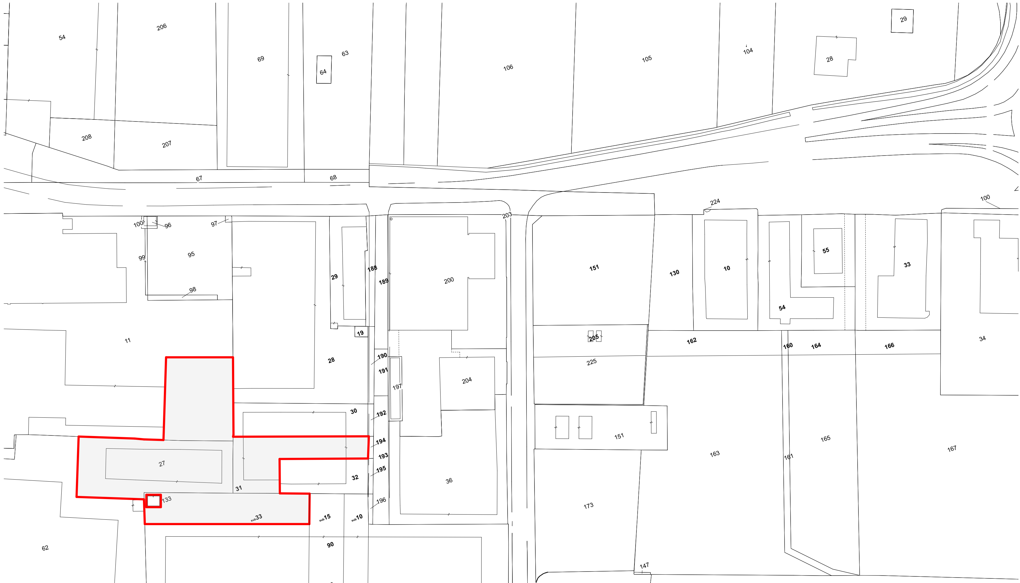
1:1000 PLANIMETRIA CATASTALE, FOGLIO 76, MAPPALE 11, 27, 31, FOGLIO 84, MAPPALE 90